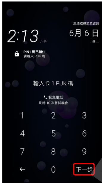
2.請輸入 8 位數 PUK 碼