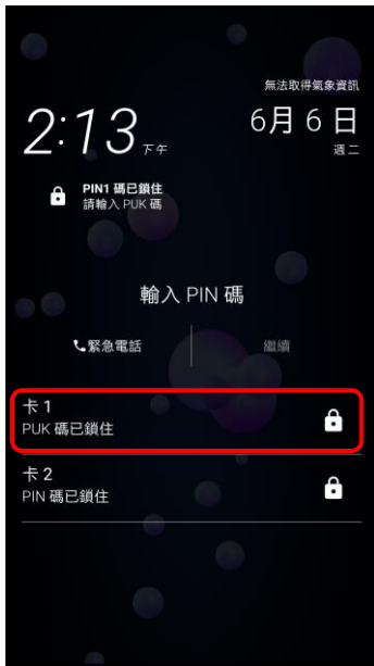
1.當輸入 PIN 碼 3 次錯誤 顯示 PUK 碼已鎖住

※輸入 PUK 碼，可以有 10 次 機會，若 10 次 錯誤 SIM 卡就會作廢