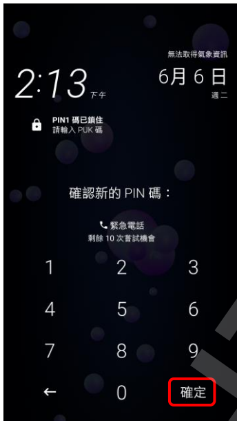
4.再次輸入自設新 PIN 碼