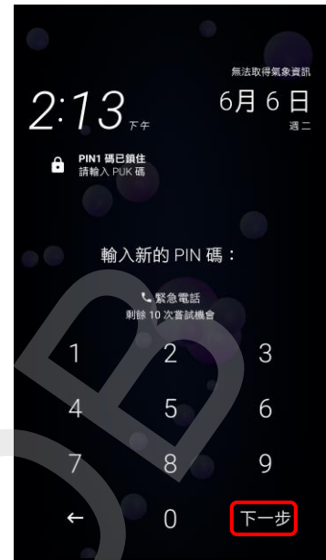
3.請輸入自設新 PIN 碼