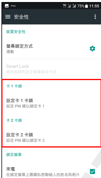
4.設定卡 1/卡 2 卡鎖 自行選擇