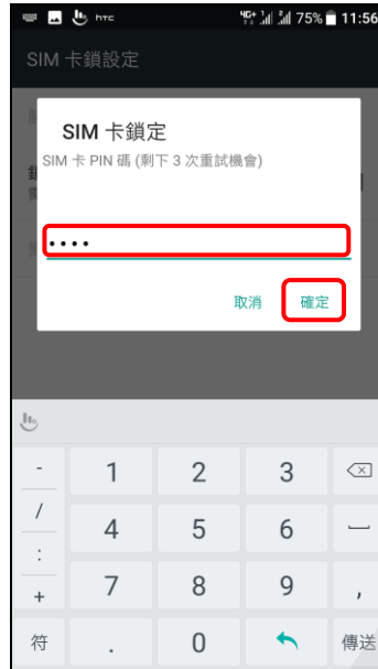
6. 輸入 SIM 卡碼