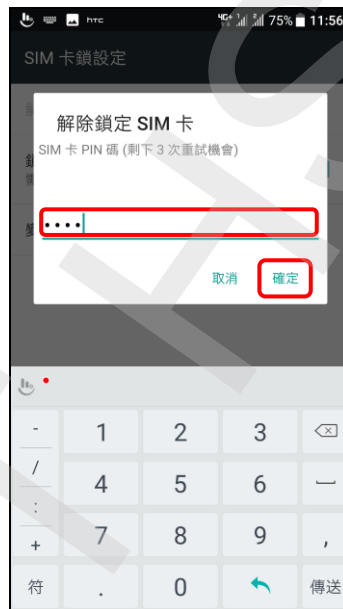
6. 輸入 SIM 卡碼