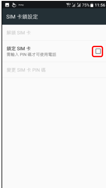
5. 鎖定 SIM 卡(開啟)