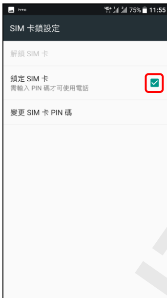
5. 鎖定 SIM 卡(關閉)