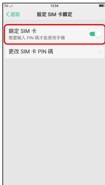
6. 鎖定 SIM 卡(關閉)