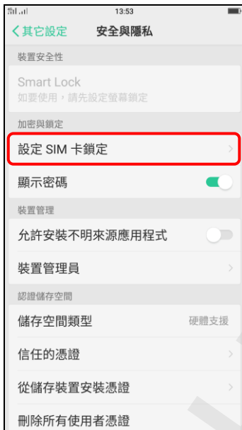
4. 設定 SIM 卡鎖定