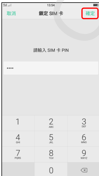
7. 輸入 SIM 卡 PIN 碼