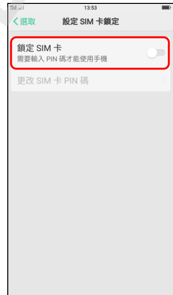
6. 鎖定 SIM 卡(開啟)