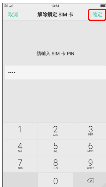
7. 輸入 SIM 卡 PIN 碼