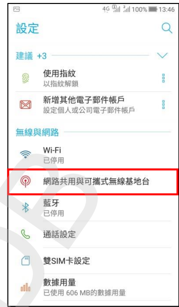
3.網路共用與可攜式無線基地台