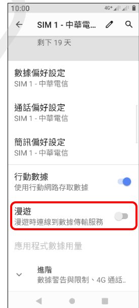
6. 漫遊 開啟