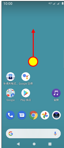
1. 上滑進入應用程式