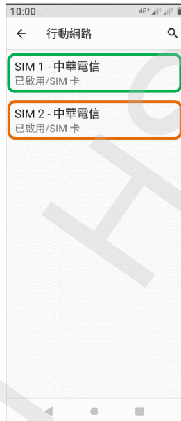
5. 選擇 SIM1/SIM2