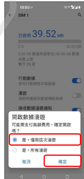
6. 自行選擇→確定 (例：是，僅限這次漫遊)