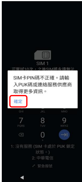
1.當輸入 PIN 碼 3 次錯誤 顯示輸入 PUK 碼→確定

※輸入 PUK 碼，可以有 10 次 機會，若 10 次錯誤 SIM 卡就會作廢