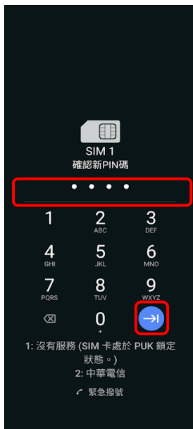
4.確認新 PIN 碼 → →