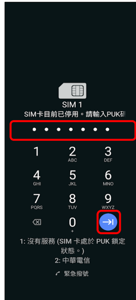
2.輸入 8 位數 PUK 碼 → →