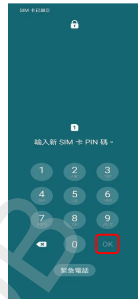
3.輸入新 SIM 卡 PIN 碼 →OK