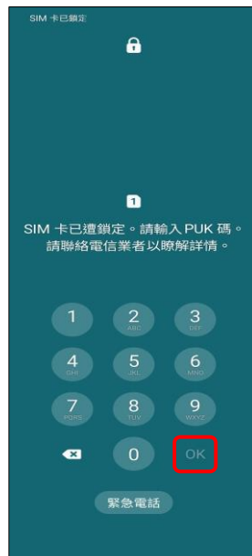
2.請輸入 8 位數 PUK 碼 →OK