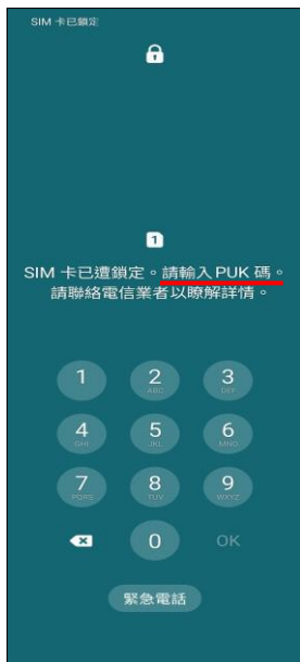
1.當輸入 PIN 碼 3 次錯誤 顯示輸入 PUK 碼