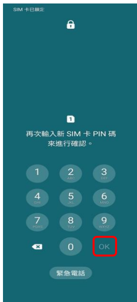
4.再次輸入新 SIM 卡 PIN 碼 →OK