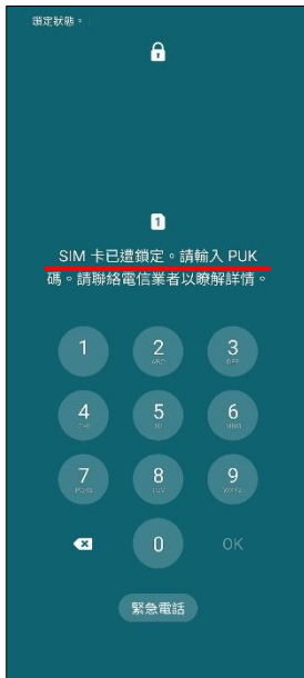
1.輸入 PIN 碼 3 次錯誤 顯示輸入 PUK 碼