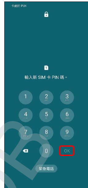
3.輸入自設新 PIN 碼 →OK