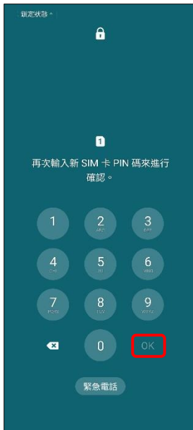
4.再次輸入新 PIN 碼 →OK