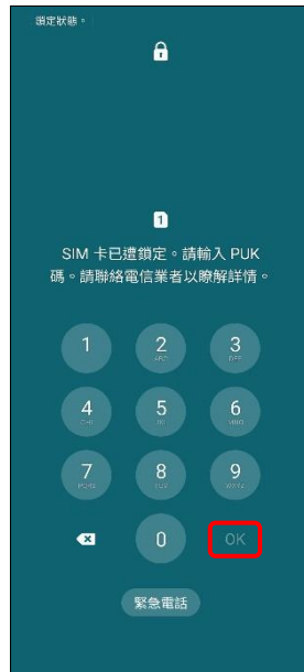
2.請輸入 8 位數 PUK 碼 →OK