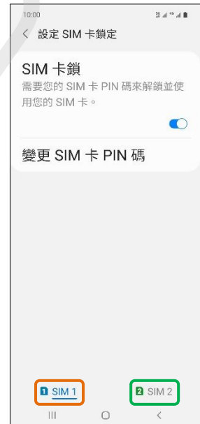
6. 選擇 SIM1/SIM2