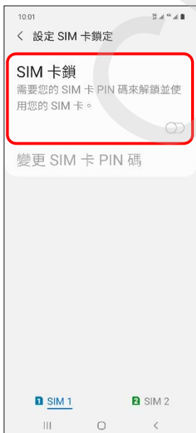
7. SIM 卡鎖→開啟