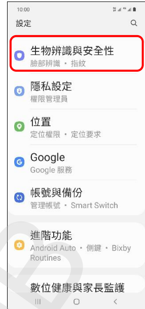
3. 生物辨識與安全性