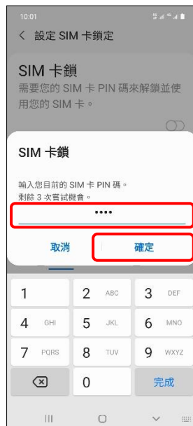
8. 輸入 SIM 卡密碼→確定