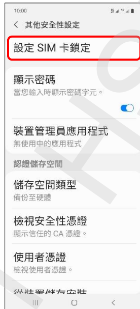
5. 設定 SIM 卡鎖定