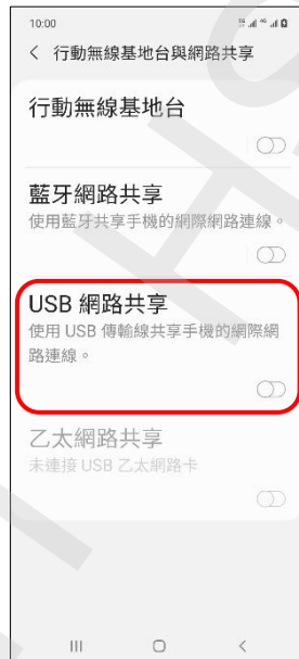
5. 將 USB 線接上→USB 網路共享 開啟