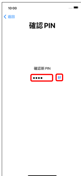
4. 確認新 PIN → 好