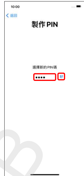
3. 選擇新的 PIN 碼 → 好