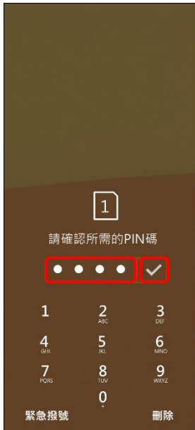
4. 請確認所需的 PIN 碼 → ✓