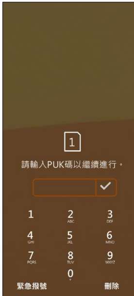
1. 當輸入 PIN 碼 3 次錯誤 顯示輸入 PUK 碼