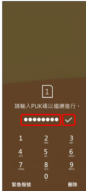
2. 請輸入 8 位數 PUK 碼 → ✓