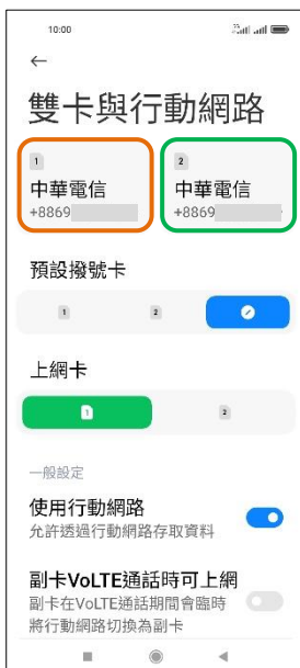
4. 選擇 SIM1/SIM2