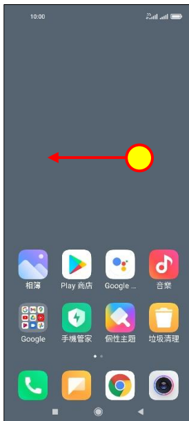
1. 往左滑進入應用程式