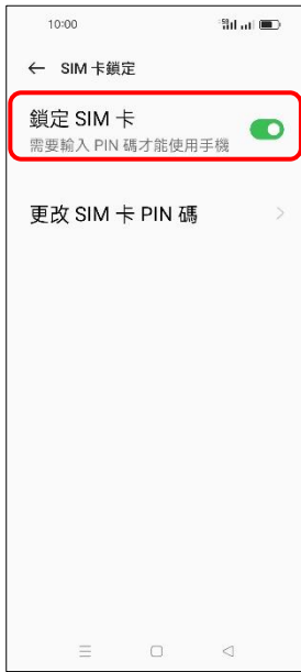
6. 鎖定 SIM 卡 → 關閉