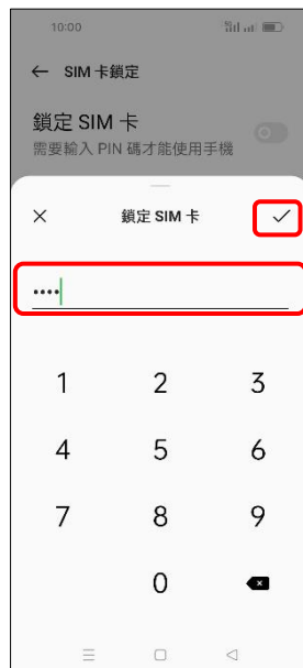
7.輸入 SIM 卡 PIN 碼 → ✓ (確定)