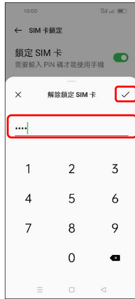
7. 輸入 SIM 卡 PIN 碼 → ✓ (確定)