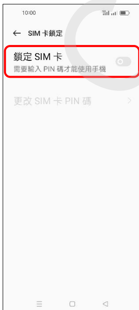
6.鎖定 SIM 卡→開啟